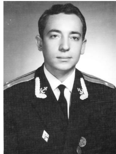
Вот таким пушистым лейтенантом я прибыл покорять балтийские просторы: две звезды – две медали.

Реже ездили на реку Куру ловить сазанов и на морскую рыбалку в Дивичи. Однажды поехали на Куру. Забросили «закидушки» с «букетами» червей (сазан их любит), повесили колокольчики, и рыбалка началась. То справа, то слева раздавалось веселое треньканье. Через пару часов имел три приличных сазана. Посадил их на кукуан и