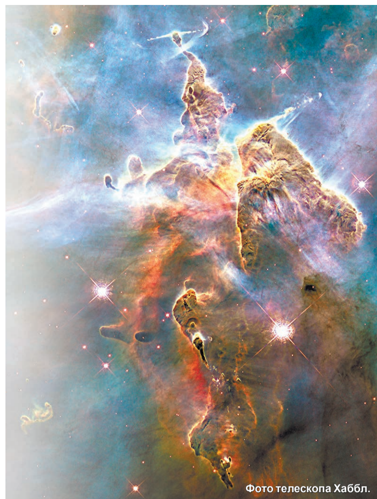
Фото телескопа Хаббл.

Потом мы делали приборы для изучения околоземного пространства и потоков заряженных частиц – так называемого