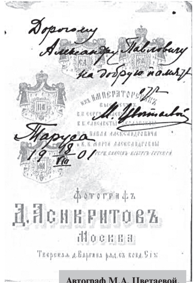
Автограф М.А. Цветаевой, Таруса. 1901 г.