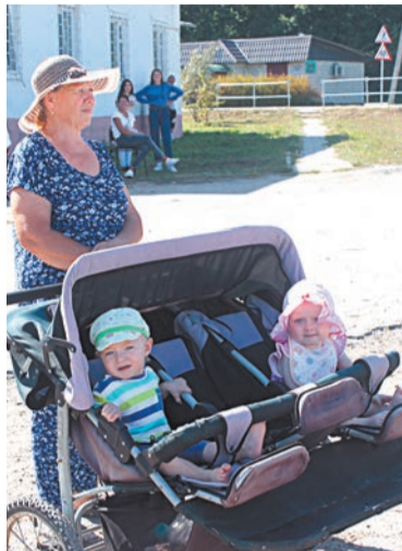
благоустройство территорий Некрасова.

- Но это еще не всё, - сказала Марина Вячеславовна под бурные аплодисменты жителей. - К диплому прилагается денежная премия за счет средств районного бюджета – на дальнейшее