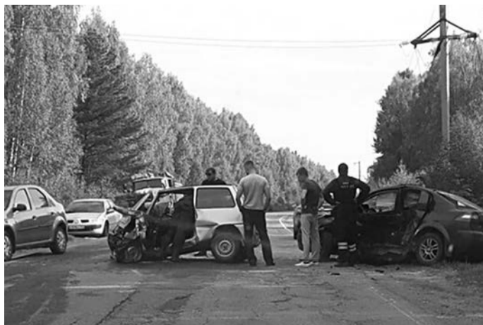
По материалам «МК-Калуга».

«По предварительной информации, женщина на «Рено» не справилась с управлением и выехала на полосу встречного движения, где столкнулась с машиной «Ока». В результате водитель второй машины, мужчина 72 лет, скончался на месте», – сообщает отдел пропаганды регионального УГИБДД. Водитель «Рено» получила травмы.