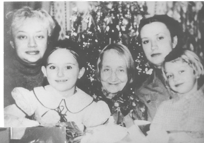
Анастасия Ивановна Цветаева с певицей Еленой Камбуровой. Москва. 1980-е годы.