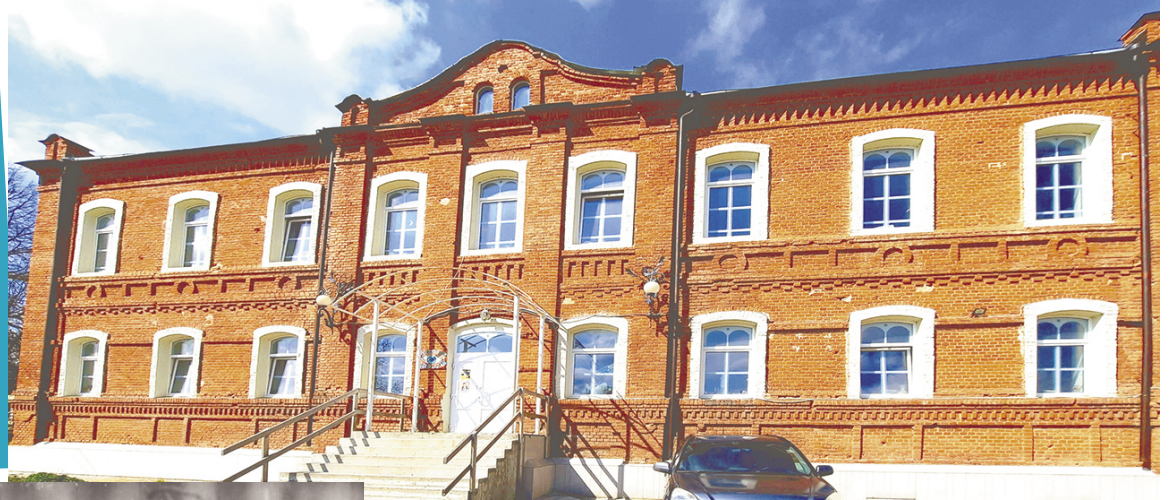
Красное здание земской больницы в Тарусе