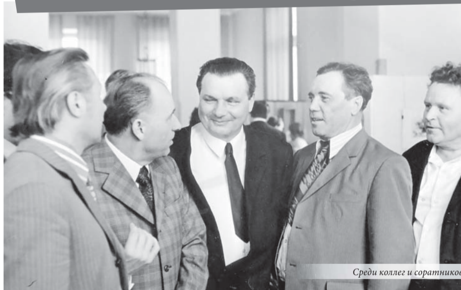
Среди коллег и соратников

года (пятница). Хороший солнечный день. Тёплый и тихий. Хорошее настроение от вчерашнего вечера, посвящённого встрече 1943 года. Первый тост был поднят за тех, кто сражается сейчас у Котельниково и Сталинграда и даёт нам возможность видеть в 43-м году НАЧАЛО КОНЦА (во всяком случае, если не конец.)»